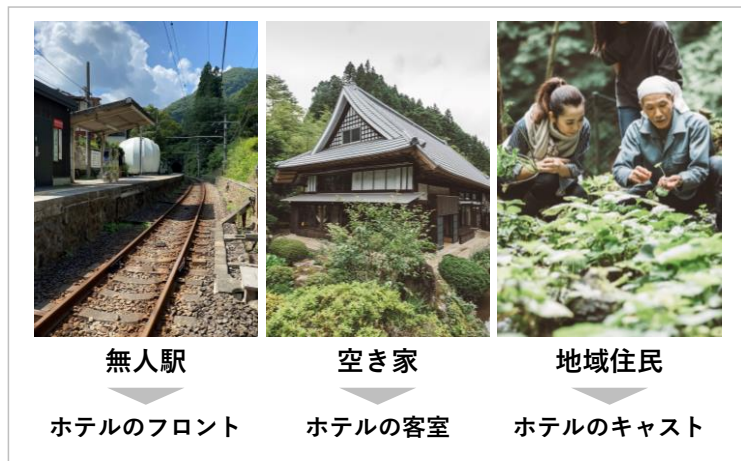
図 沿線まるごとホテルの事業イメージ