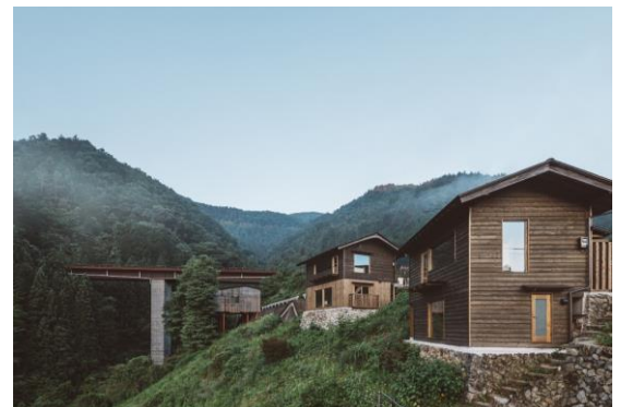
さとゆめプロデュース「NIPPONIA 小菅 源流の村」