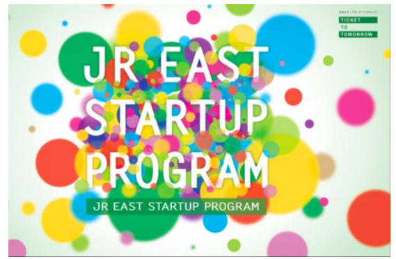
JR東日本スタートアッププログラム