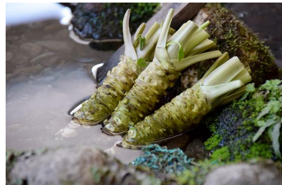
写真は試験栽培時の写真です。