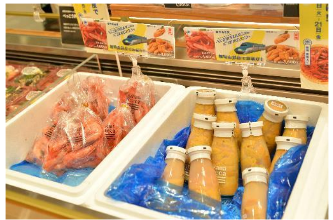
写真は前回実施時の写真です。