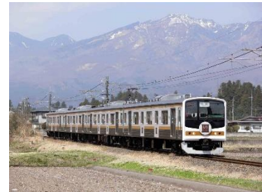
▲「いろは」編成のイメージ

2019年11月2日（土）～4日（月・祝）の間に運行する全車指定席の臨時列車です。運転区間は、川越（10:00 発）～日光（12:39 着）、日光（19:11 発）～大宮（21:33 着）。205系4両「いろは」編成で運転します。「いろは」編成は、2018年4月1日（日）から運行している観光仕様の列車です。