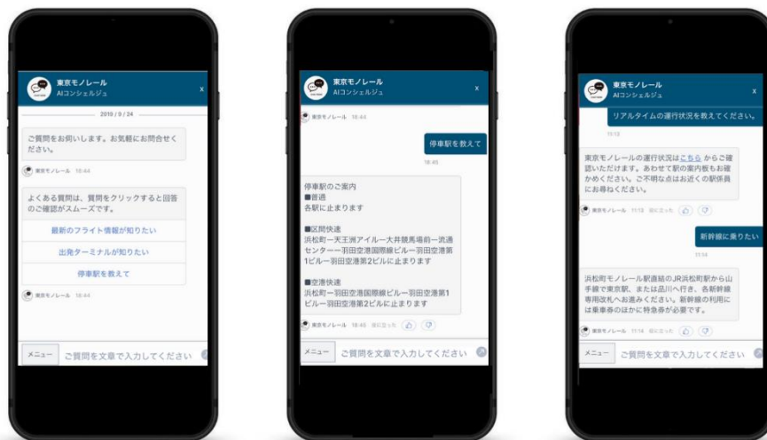
東京モノレール 「tripla チャットボット」利用イメージ

※1：旅行特化型チャットボットサービスを展開する tripla 社が JR 東日本スタートアッププログラム 2018 を通じて実証実験を開始 https://corp.tripla.jp/20181127-2