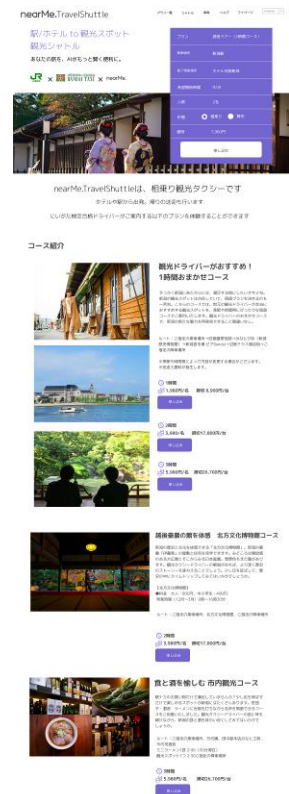
予約WEBサイトイメージ