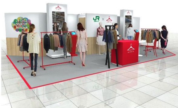
品川駅 会場イメージ