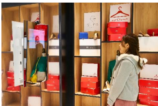
遠隔ファッション診断 体験イメージ

これは、駅における「時間価値の創造」と忙しい女性へ「より豊かなライフスタイルの提供」を目的に実施する施策で、お客様がスタイリストと遠隔にいる状態において、リアルタイムにパーソナルスタイリングを受けられる体験型コンテンツです。