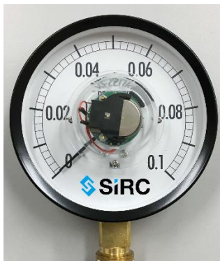
圧力計(中心部に SIRC デバイスを使用)