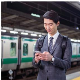
1 専用ページへアクセス