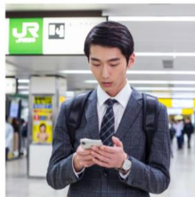
3 調理完了をお知らせ