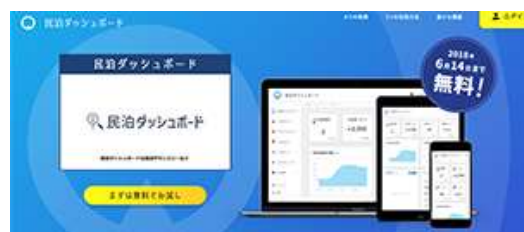
▲民泊向けシステム「民泊ダッシュボード」イメージ