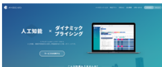
▲ホテル向けシステム「メトロエンジン」イメージ

メトロエンジン株式会社は、民泊・ホテル、旅館事業者向けに管理ツールやサービスを展開している企業です。ホテル・旅館事業者向けに、AI、機械学習機能を取り入れた客室単価設定ツールや各種分析、運営効率化を追求するWEBサービス展開しています。民泊事業者向けには、民泊物件予約管理システム「民泊ダッシュボード」、ホテル・旅館向けには客室単価設定ツールの「メトロエンジン」と、宿泊業界などにテクノロジーを活用したシステムを提供しています。